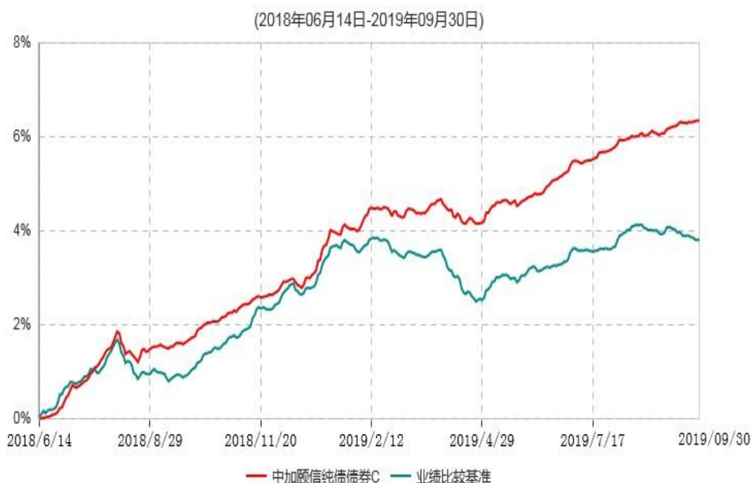
中加颐信纯债债券C累计净值增长率与业绩比较基准收益率历史走势对比图

注：1. 本基金基金合同于 2018 年 6 月 14 日生效，截至报告期末，本基金基金合同生效已满一年。