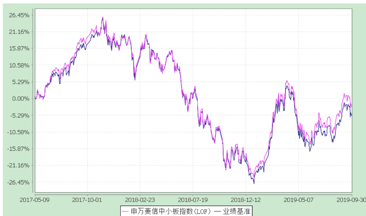
申万菱信中小板指数证券投资基金(LOF)C 累计净值增长率与业绩比较基准收益率的历史走势对比图 (2019年8月8日至2019年9月30日)