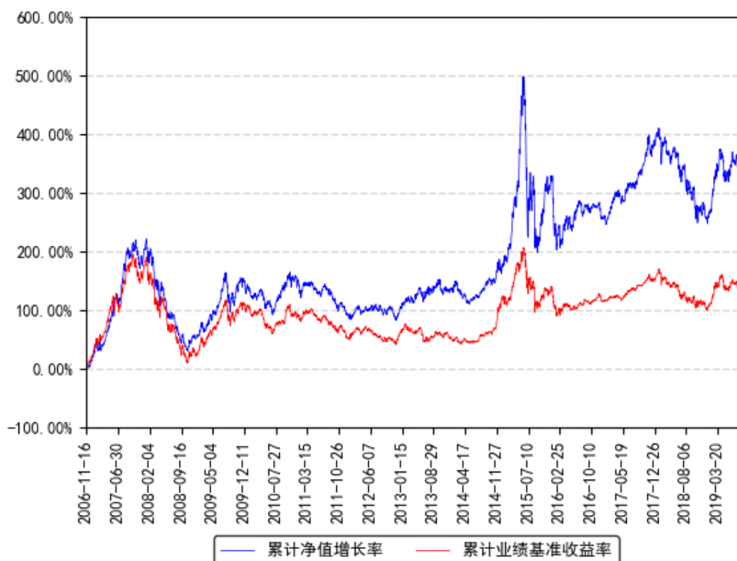
南方绩优A累计净值增长率与同期业绩比较基准收益率的历史走势对比图