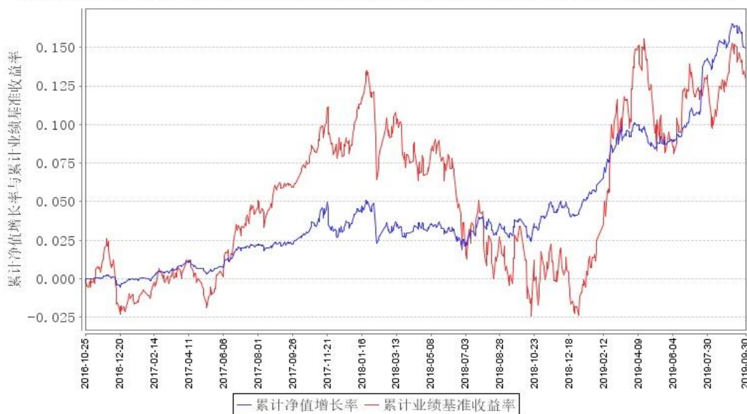
鹏华弘尚混合A类累计净值增长率与同期业绩比较基准收益率的历史走势对比图