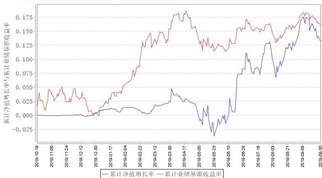
鹏华金鼎混合A累计净值增长率与同期业绩比较基准收益率的历史走势对比图