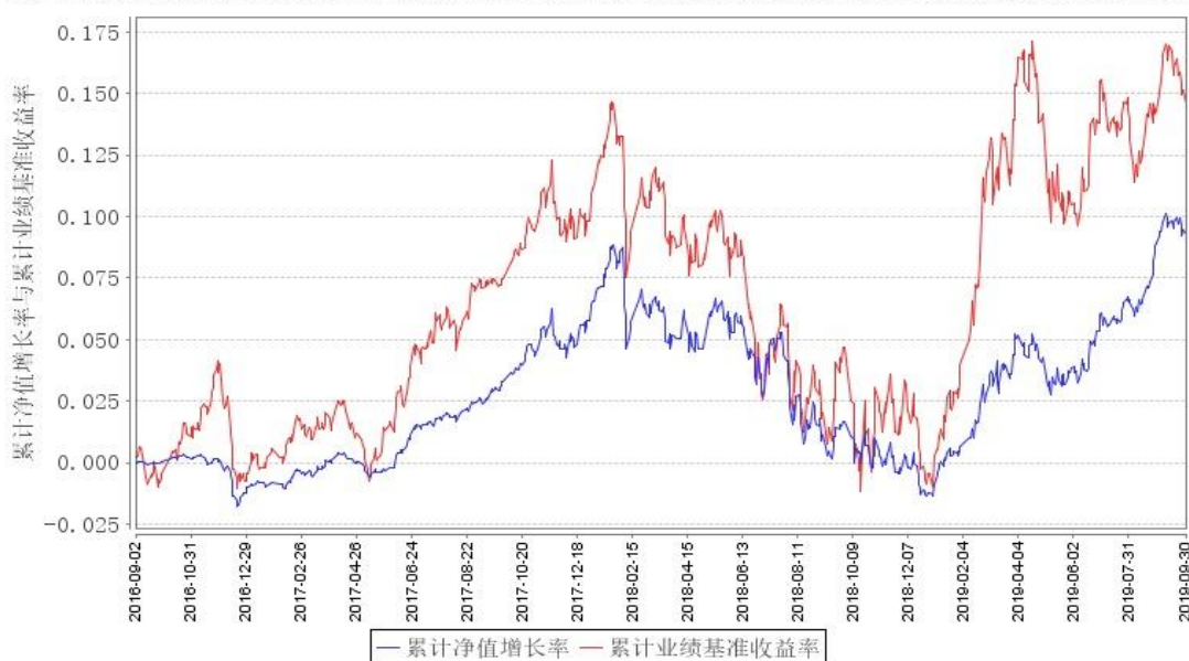
鹏华兴润定期开放A累计净值增长率与同期业绩比较基准收益率的历史走势对比图