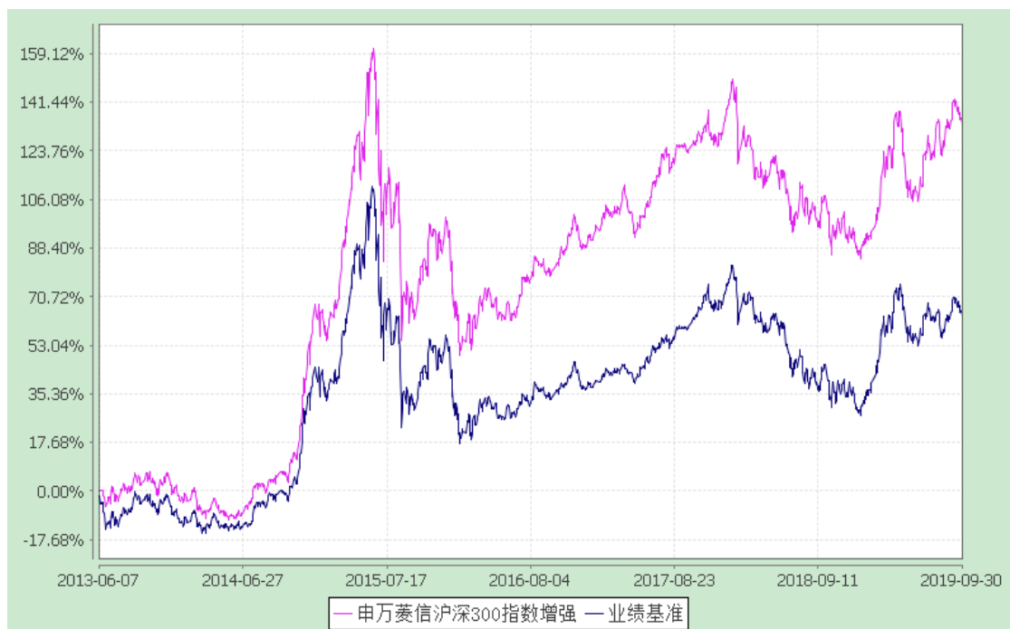
申万菱信沪深 300 指数增强型证券投资基金 C 累计净值增长率与业绩比较基准收益率的历史走势对比图 (2019 年 8 月 8 日至 2019 年 9 月 30 日)