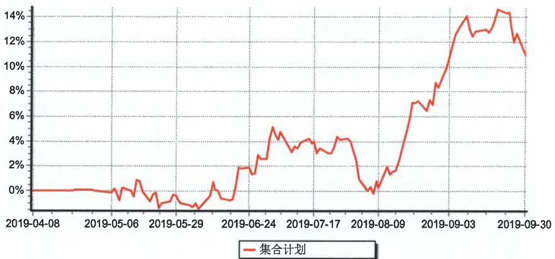
集合计划累计单位净值增长率历史走势图