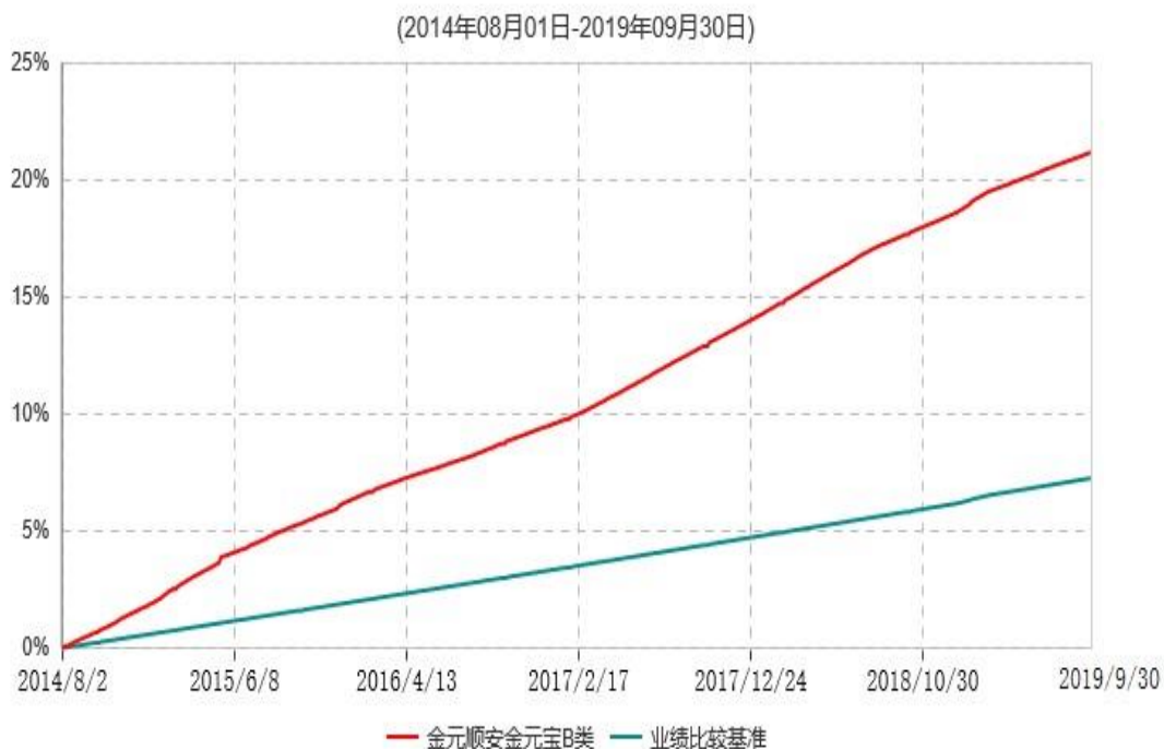
金元顺安金元宝B类累计净值收益率与业绩比较基准收益率历史走势对比图