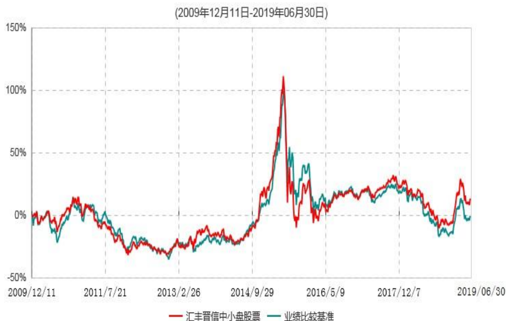
汇丰晋信中小盘股票型证券投资基金累计净值增长率与业绩比较基准收益率历史走势对比图

注：1. 按照基金合同的约定，本基金的股票投资比例范围为基金资产的 85%-95%，其中，将不低于 80%的股票资产投资于国内 A 股市场上具有良好成长性和基本面良好的中小上市公司股票。本基金权证投资比例范围为基金资产净值的 0%-3%。本基金固定收益类证券和现金投资比例范围为基金资产的 5%-15%，其中现金（不包括结算备付金、存出保证金、应收申购款等）或到期日在一年以内的政府债券的投资比例不低于基金资产净值的 5%。按照基金合同的约定，本基金自基金合同生效日起不超过 6 个月内完成建仓，截止 2010 年 6 月 11 日，本基金的各项投资比例已达到基金合同约定的比例。