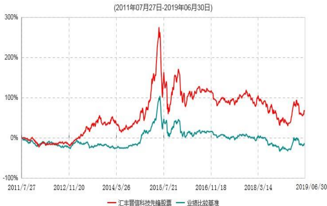
汇丰晋信科技先锋股票型证券投资基金累计净值增长率与业绩比较基准收益率历史走势对比图