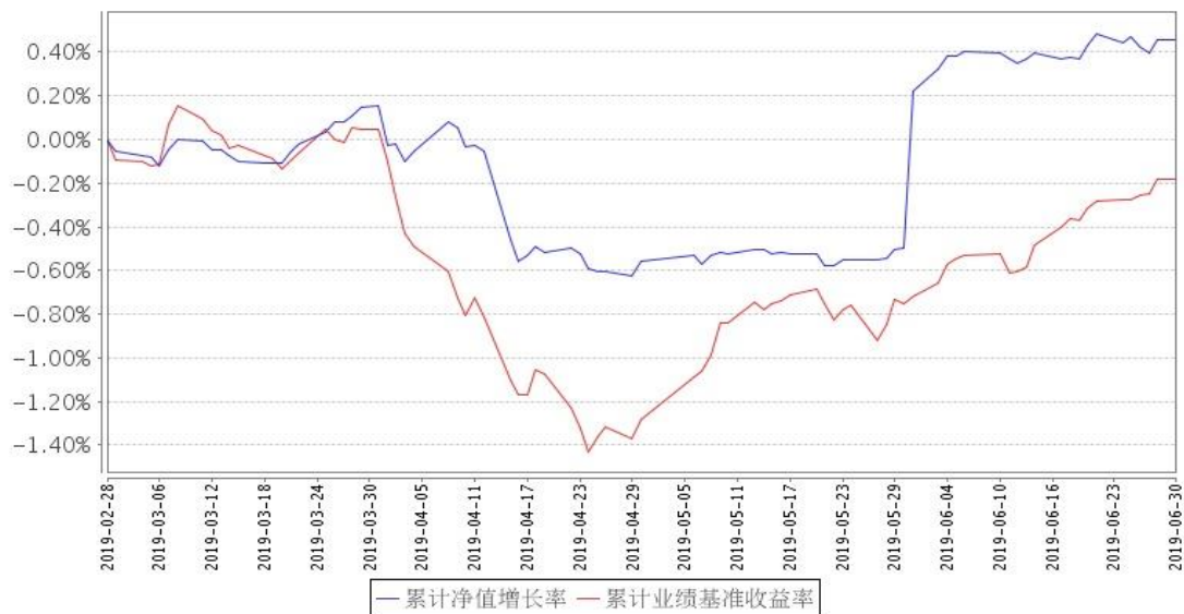
景顺长城政策性金融债债券型证券投资基金累计净值增长率与同期业绩比较基准收益率的历史走势对比图

注:2019 年 2 月 28 日, 景顺长城景瑞双利债券型证券投资基金转型为景顺长城政策性金融债债券型证券投资基金 (以下简称“本基金”)。基金的投资组合比例为: 本基金对债券资产的投资比例不低于基金资产的 80%, 投资于政策性金融债 (国家开发银行、中国农业发展银行、中国进出口银行发行的金融债券) 比例不低于非现金基金资产的 80%。本基金持有现金或到期日在一年以内的政府债券的投资比例不低于基金资产净值的 5%, 其中现金不包括结算备付金、存出保证金和应收申购款等。本基金的建仓期为自 2019 年 2 月 28 日转型后基金合同生效日起 6 个月。截至本报告期末, 本基金仍处于建仓期。基金合同生效日 (2019