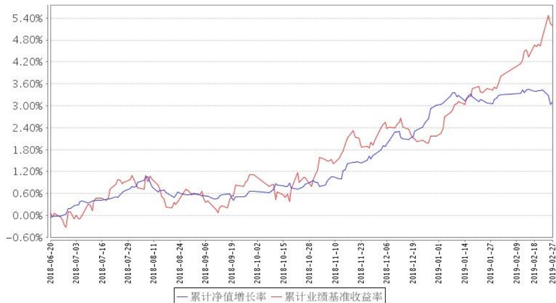
景顺长城景瑞双利债券累计净值增长率与同期业绩比较基准收益率的历史走势对比图

注：因景顺长城景瑞双利定期开放债券型证券投资基金（以下简称“景瑞双利定期开放债券基金”）触发基金合同约定的转型条款，该基金自 2018 年 6 月 20 日转型为景顺长城景瑞双利债券型证券投资基金（以下简称“景瑞双利债券基金”）。