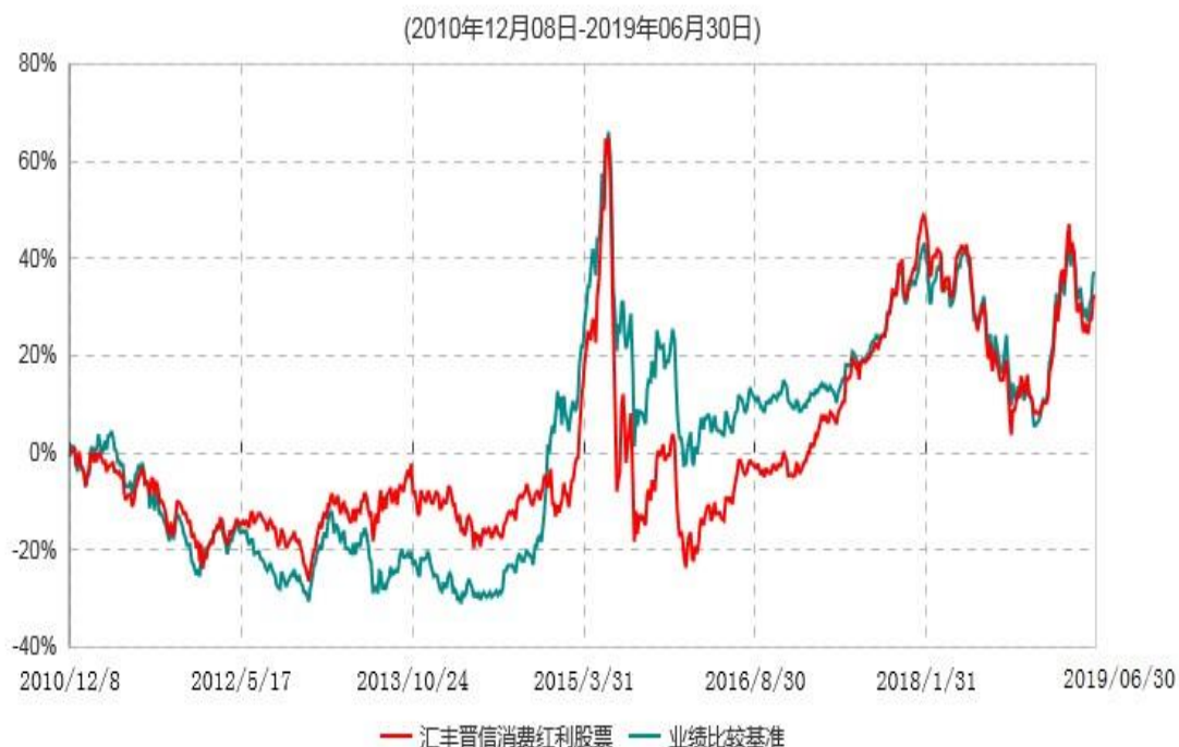
汇丰晋信消费红利股票型证券投资基金累计净值增长率与业绩比较基准收益率历史走势对比图

注：1.按照基金合同的约定，本基金的投资组合比例为：股票投资比例范围为基金资产的85%-95%，权证投资比例范围为基金资产净值的0%-3%。固定收益类证券、现金和其他资产投资比例范围为基金资产的5%-15%，其中现金（不包括结算备付金、存出保证金、应收申购款等）或到期日在一年以内的政府债券的投资比例不低于基金资产净值的5%。按照基金合同的约定，本基金自基金合同生效日起不超过6个月内完成建仓，截止2011年6月8日，本基金的各项投资比例已达到基金合同约定的比例。