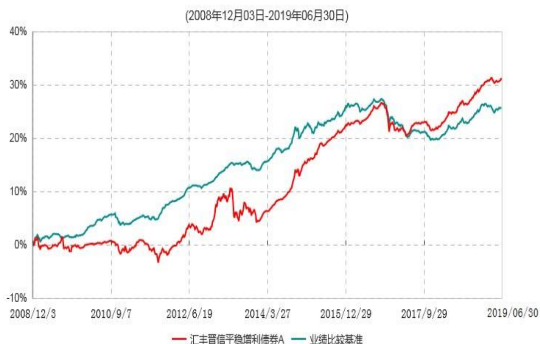
汇丰晋信平稳增利债券A累计净值增长率与业绩比较基准收益率历史走势对比图

注：1. 按照基金合同的约定，本基金主要投资于具有较高息票率的债券品种，包括国债、企业债、公司债、短期融资券、资产支持证券(含资产收益计划)、可转换债券等，投资比例不低于基金资产的 80%，现金或者到期日在一年以内的政府债券不低于基金资产净值的 5%。现金不包括结算备付金、存出保证金、应收申购款等。按照基金合同的约定，本基金自基金合同生效日起不超过 6 个月内完成建仓，截止 2009 年 6 月 3 日，本基金的各项投资比例已达到基金合同约定的比例。