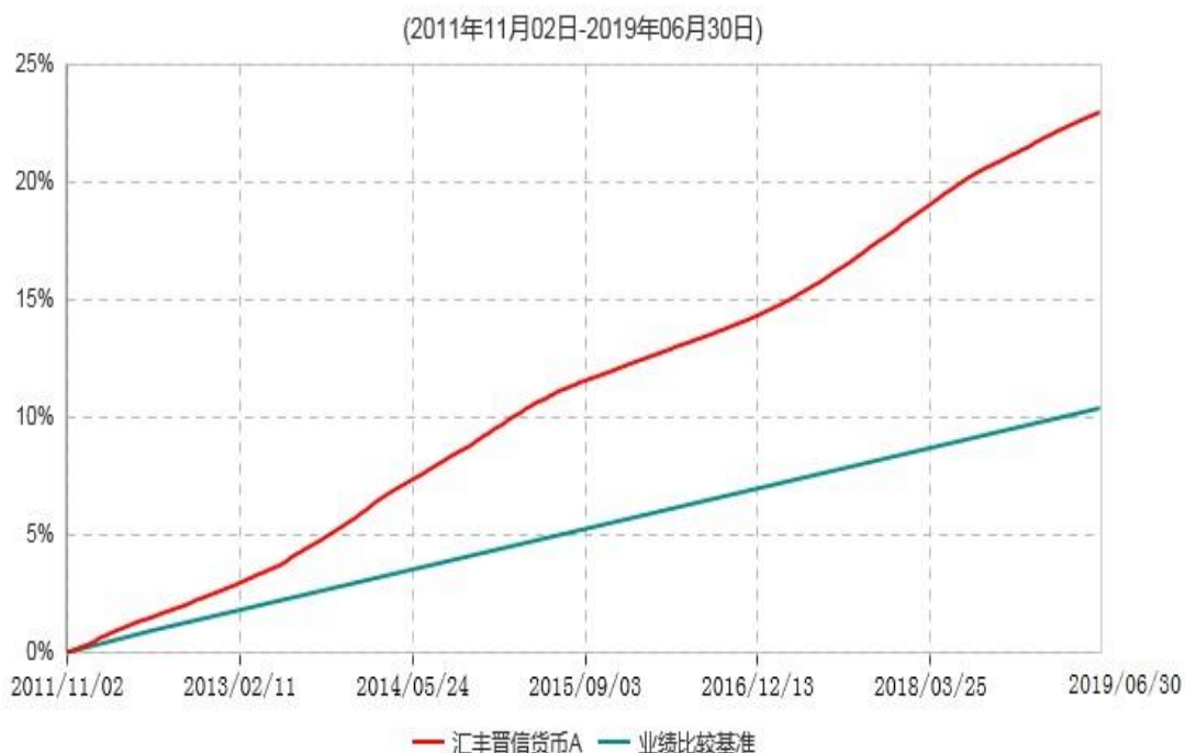
汇丰晋信货币A累计净值收益率与业绩比较基准收益率历史走势对比图