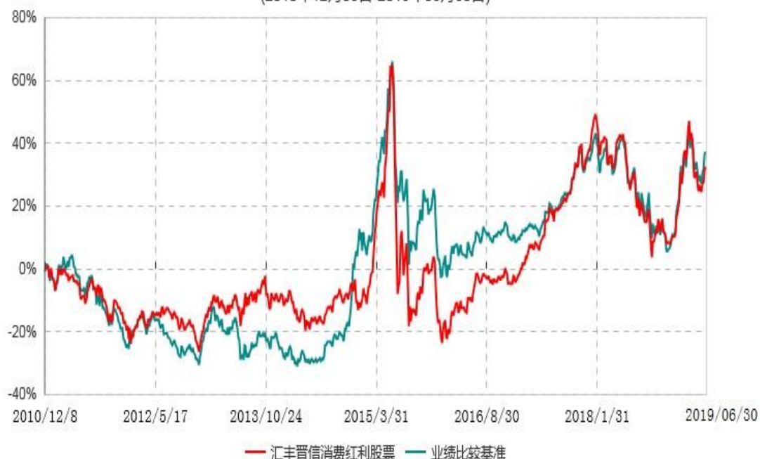
汇丰晋信消费红利股票型证券投资基金累计净值增长率与业绩比较基准收益率历史走势对比图 (2010年12月08日-2019年06月30日)

注：1.按照基金合同的约定，本基金的投资组合比例为：股票投资比例范围为基金资产的85%-95%，权证投资比例范围为基金资产净值的0%-3%。固定收益类证券、现金和其他资产投资比例范围为基金资产的5%-15%，其中现金（不包括结算备付金、存出保证金、应收申购款等）或到期日在一年以内的政府债券的投资比例不低于基金资产净值的5%。按照基金合同的约定，本基金自基金合同生效日起不超过6个月内完成建仓，截止2011年6月8日，本基金的各项投资比例已达到基金合同约定的比例。