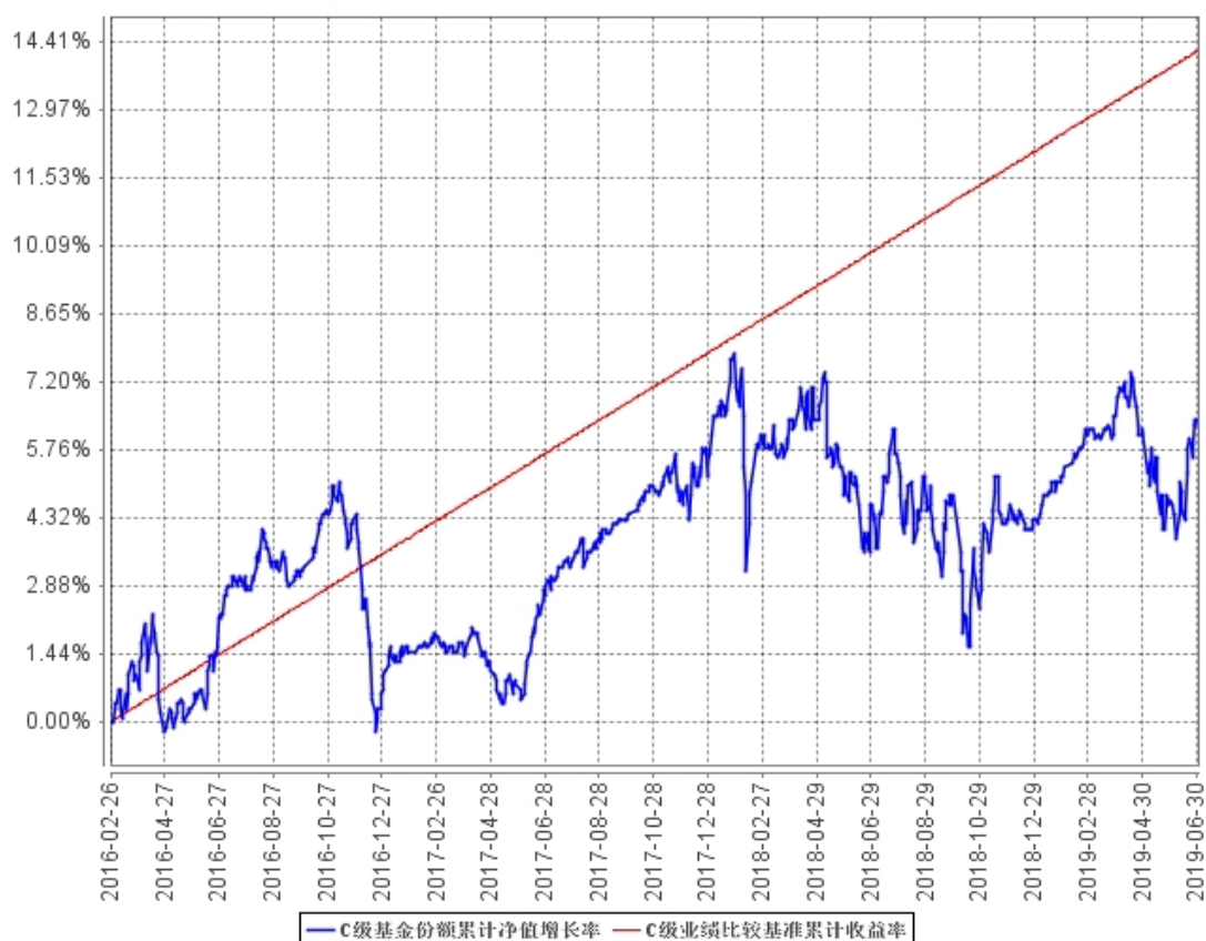
C级基金份额累计净值增长率与同期业绩比较基准收益率的历史走势对比图