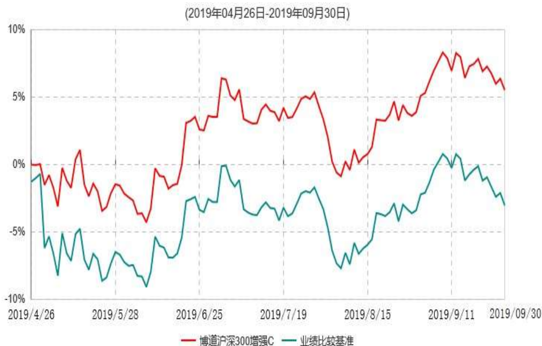
博道沪深300增强C累计净值增长率与业绩比较基准收益率历史走势对比图

注：本基金基金合同生效日为2019年4月26日，基金合同生效日至报告期期末，本基金运作时间未满一年。本基金建仓期为自基金合同生效日起的6个月。截至2019年9月30日，本基金尚处于建仓期。