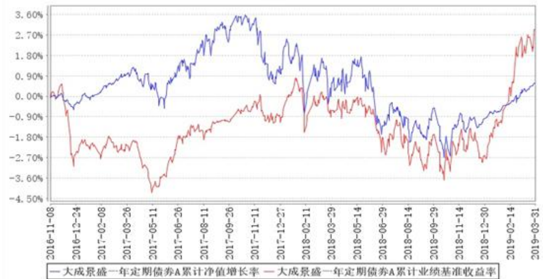
大成景盛一年定期债券A累计净值增长率与同期业绩比较基准收益率的历史走势对比图

(二)自基金合同生效以来基金累计净值增长率变动及其与同期业绩比较基准收益率变动的比较