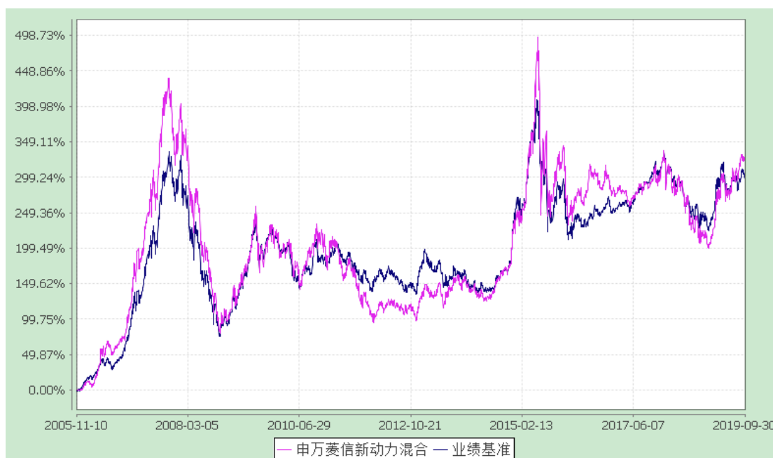
申万菱信新动力混合型证券投资基金 累计净值增长率与业绩比较基准收益率历史走势对比图 (2005年11月10日至2019年9月30日)

2. 自《基金合同》生效以来基金份额累计净值增长率与同期业绩比较基准的变动比较。