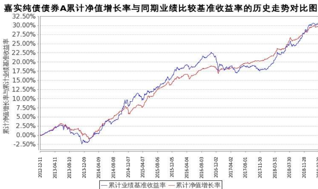
图1：嘉实纯债债券A基金份额累计净值增长率与同期业绩比较基准收益率的历史走势对比

(二) 自基金合同生效以来基金累计净值增长率变动及其与同期业绩比较基准收益率变动的比较