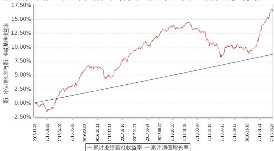
图 2：嘉实新兴市场 C2 份额累计净值增长率与同期业绩比较基准收益率的历史走势对比图（2015 年 11 月 26 日至 2019 年 3 月 31 日）

注：按基金合同和招募说明书的约定，本基金自基金合同生效日起 6 个月内为建仓期，建仓