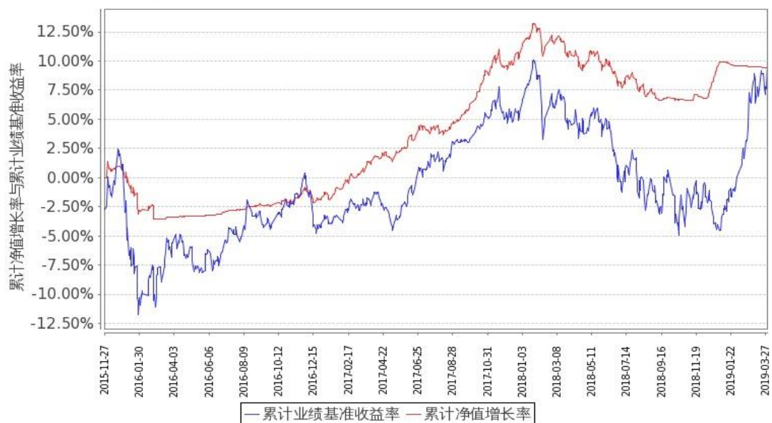
图1：嘉实新起点混合 A 基金份额累计净值增长率与同期业绩比较基准收益率的历史走势对比图