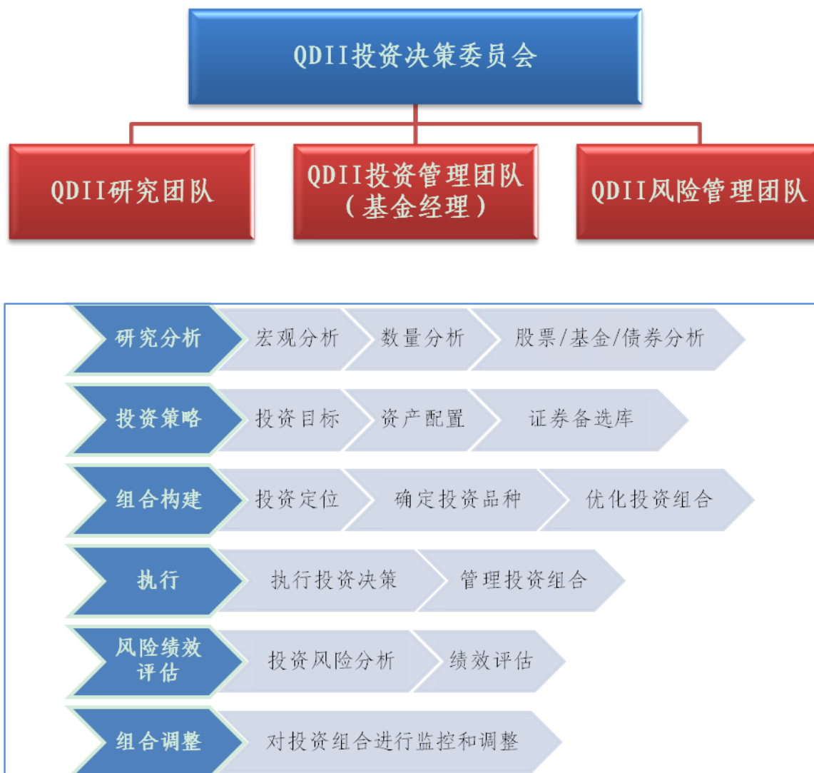
图 2：QDII 投资决策机制和投资管理流程