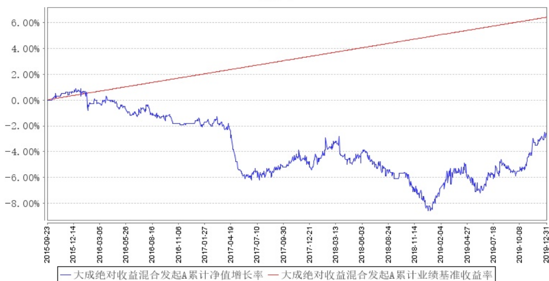
大成绝对收益混合发起A累计净值增长率与同期业绩比较基准收益率的历史走势对比图