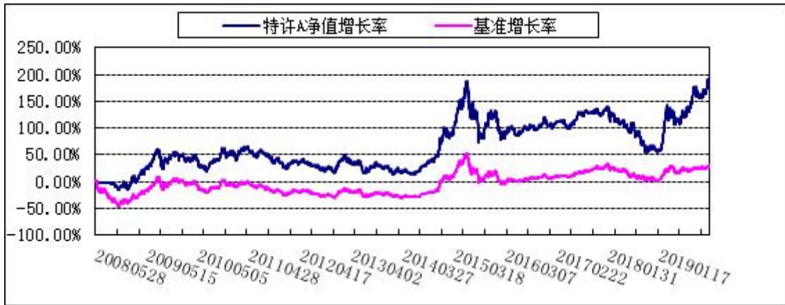
2. 博时特许价值混合R: