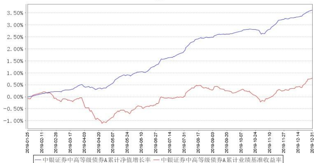
中银证券中高等级债券A累计净值增长率与同期业绩比较基准收益率的历史走势对比图