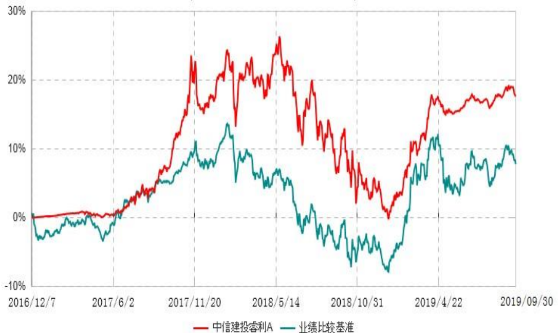
中信建投睿利A累计净值增长率与业绩比较基准收益率历史走势对比图 (2016年12月07日-2019年09月30日)