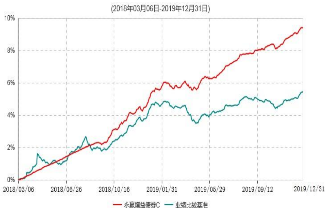
永赢增益债券C累计净值增长率与业绩比较基准收益率历史走势对比图

注：本基金建仓期为本基金合同生效日起 6 个月，建仓期结束当日，除债券投资比例未达到合同约定外，其他各项资产配置符合合同约定。债券投资比例未达到合同约定系交易对手原因导致现券买入交易结算失败所致，本基金于 2018 年 9 月 6 日及时买入债券将债券投资比例提高至合同约定的范围内。