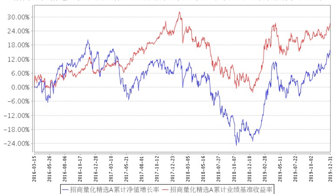
招商量化精选A累计净值增长率与同期业绩比较基准收益率的历史走势对比图