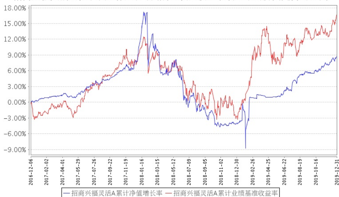
招商兴福灵活A累计净值增长率与同期业绩比较基准收益率的历史走势对比图