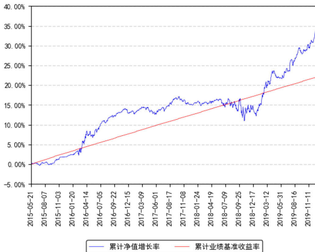
南方利众A类累计净值增长率与同期业绩比较基准收益率的历史走势对比图