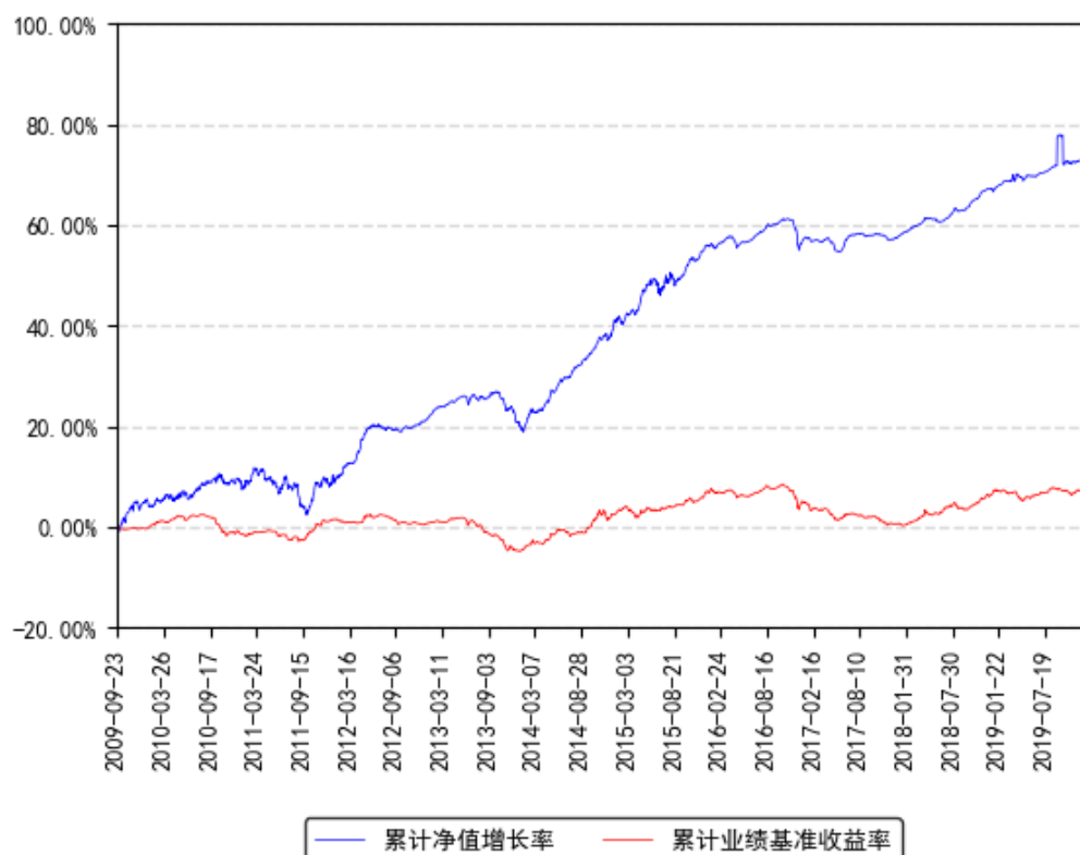
南方多利增强债券A累计净值增长率与同期业绩比较基准收益率的历史走势对比图