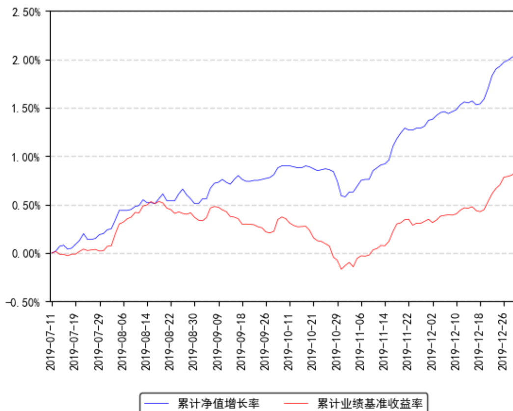
南方泰元A累计净值增长率与同期业绩比较基准收益率的历史走势对比图