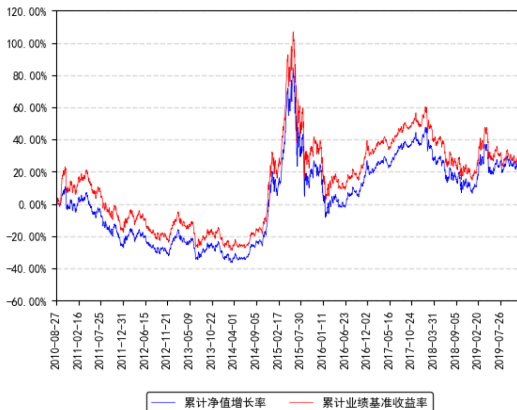
南方小康A累计净值增长率与同期业绩比较基准收益率的历史走势对比图