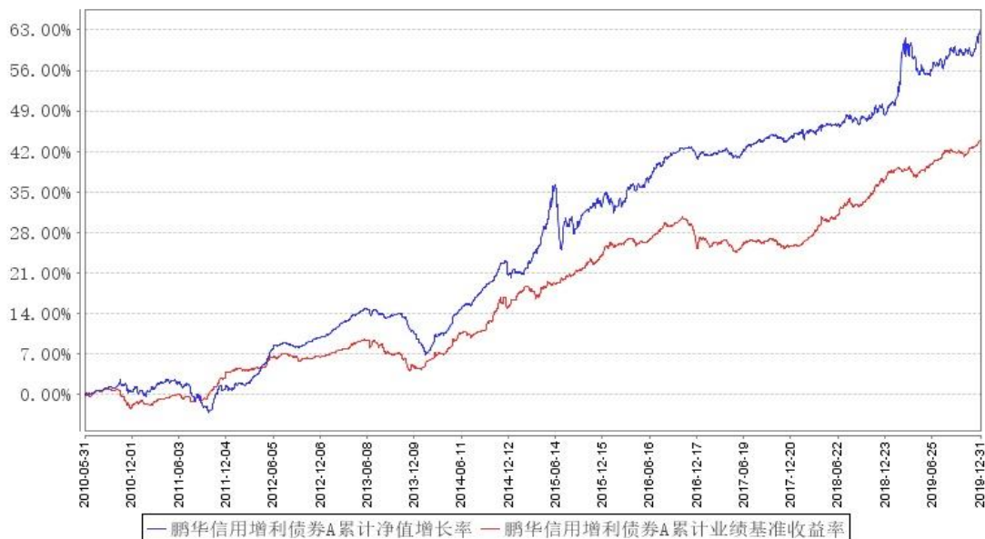
鹏华信用增利债券A累计净值增长率与同期业绩比较基准收益率的历史走势对比图