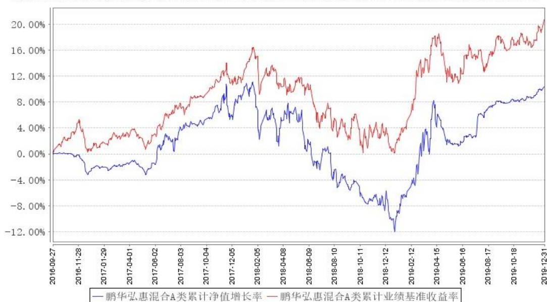
鹏华弘惠混合A类累计净值增长率与同期业绩比较基准收益率的历史走势对比图