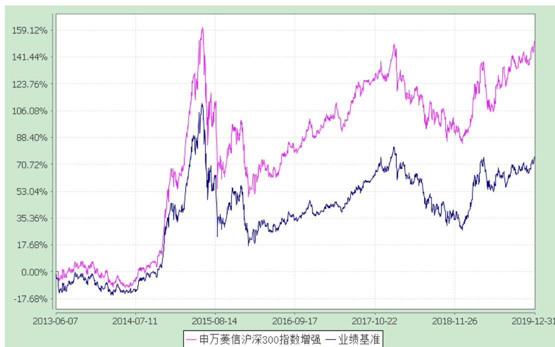
申万菱信沪深 300 指数增强 C