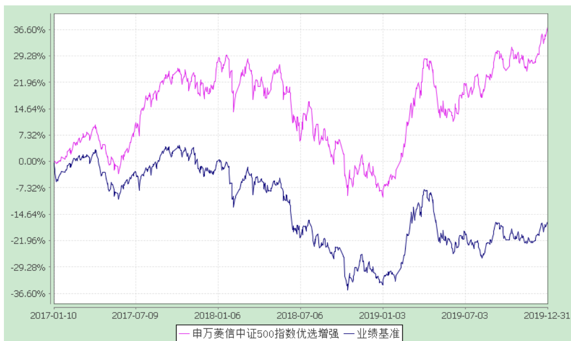
申万菱信中证 500 指数优选增强 C