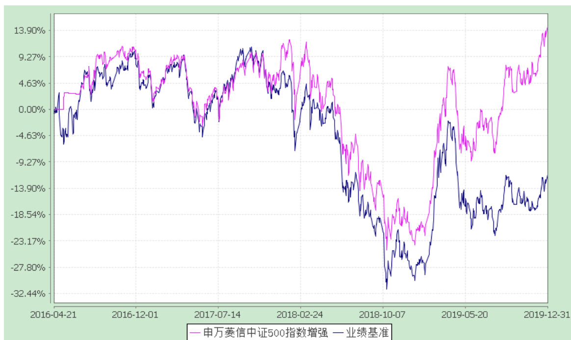
申万菱信中证 500 指数增强 C