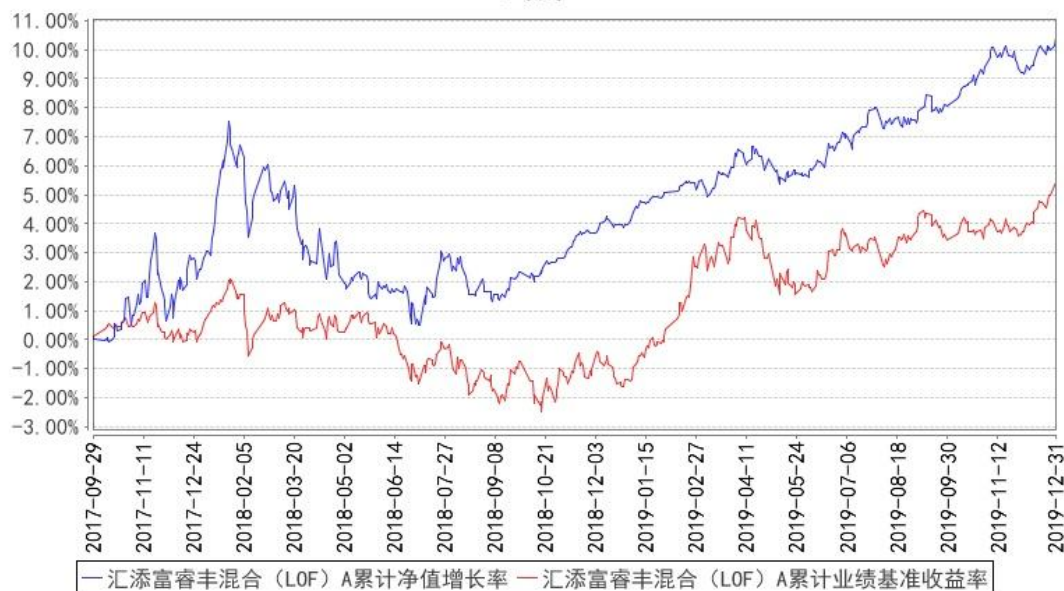
汇添富睿丰混合（LOF）A 累计净值增长率与同期业绩比较基准收益率的历史走势对比图