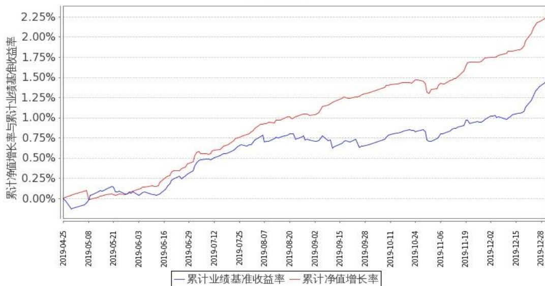
图 2: 嘉实中债 1-3 政金债指数 C 基金份额累计净值增长率与同期业绩比较基准收益率的历史走势对比图