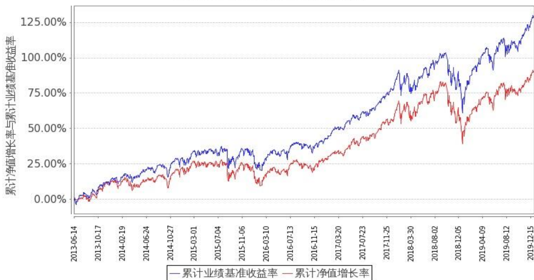
图 2：嘉实美国成长股票(QDII)美元现汇基金份额累计净值增长率与同期业绩比较基准收益率的历史走势对比图