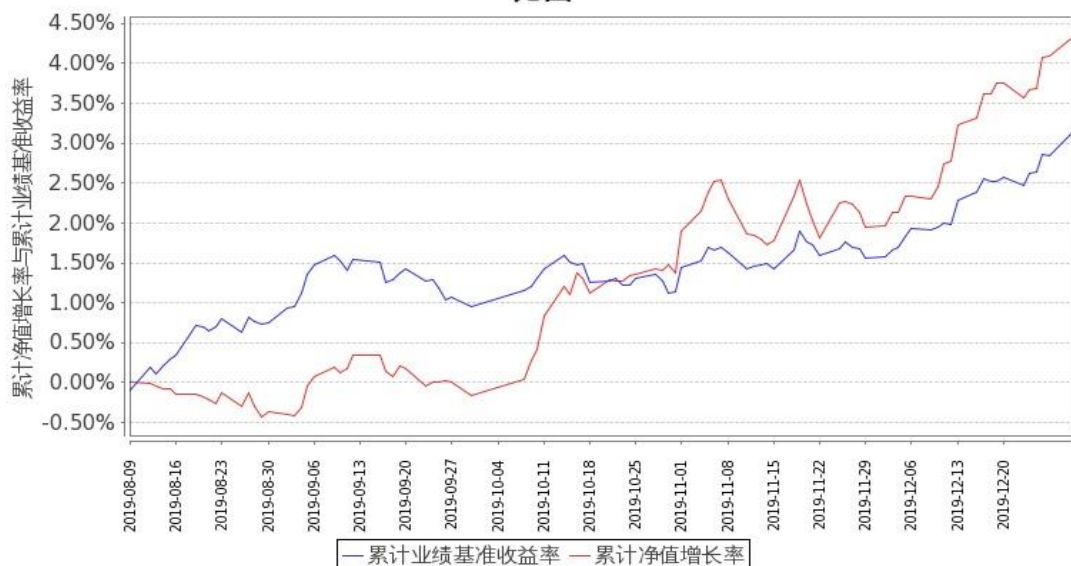
嘉实新添益定期混合C累计净值增长率与同期业绩比较基准收益率的历史走势对比图