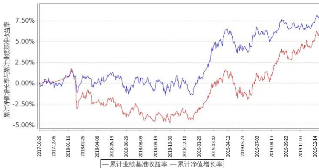
图 1：嘉实领航资产配置混合(FOF)A 基金份额累计净值增长率与同期业绩比较基准收益率的历史走势对比图