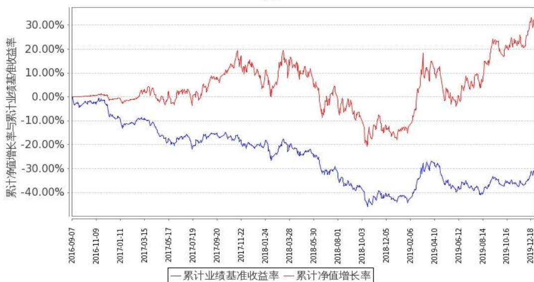
图 1：嘉实文体娱乐股票 A 基金份额累计净值增长率与同期业绩比较基准收益率的历史走势对比图