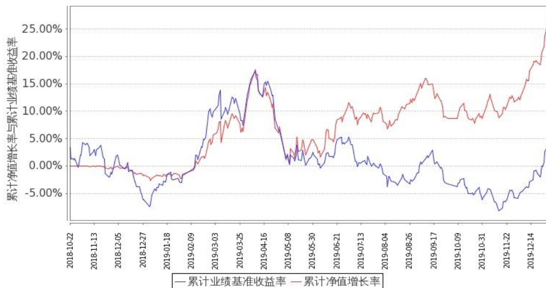
图 1：嘉实资源精选股票 A 基金份额累计净值增长率与同期业绩比较基准收益率的历史走势对比图