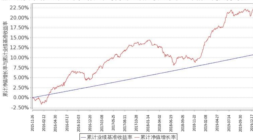
图 2：嘉实新兴市场 C2 基金份额累计净值增长率与同期业绩比较基准收益率的历史走势对比图