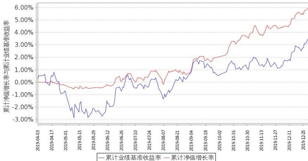
图 1：嘉实新添元定期混合 A 基金份额累计净值增长率与同期业绩比较基准收益率的历史走势对比图