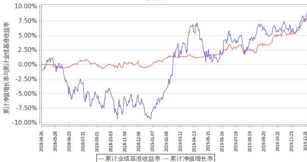
图 2：嘉实新添荣定期混合 C 基金份额累计净值增长率与同期业绩比较基准收益率的历史走势对比图